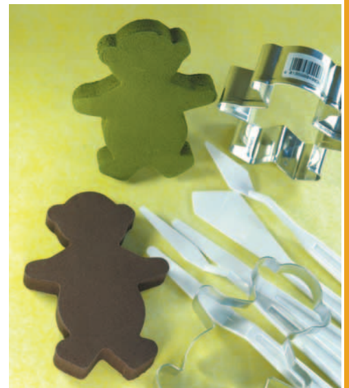
...Kleine Geschenke gestalten