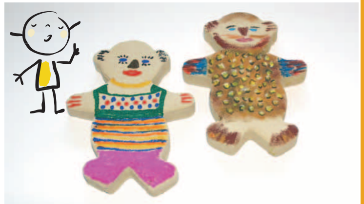
...nach Lust & Laune bemalen