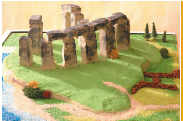
...Anschauungs-Modelle, auch farbig