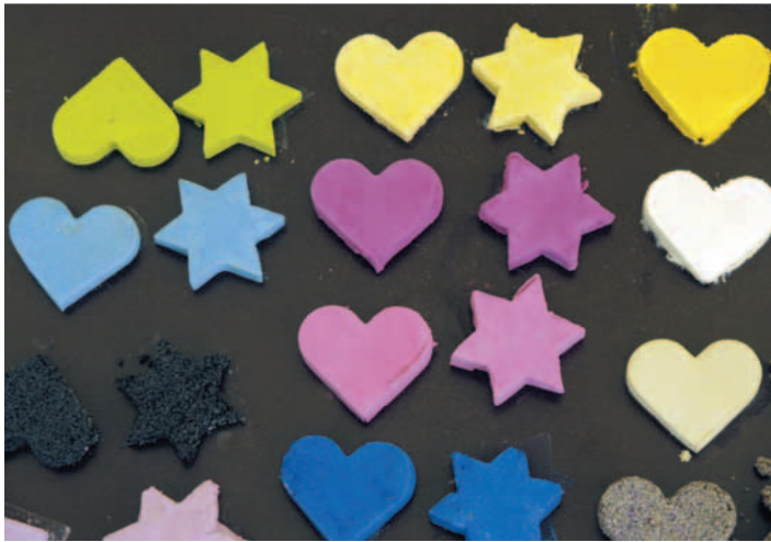
...Ausstechen mittels Backformen