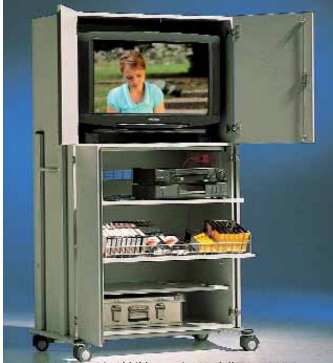
Die Abbildung zeigt Modell TV220R VKB, Dekor Grau 20, Metallteile RAL 7035 Lichtgrau