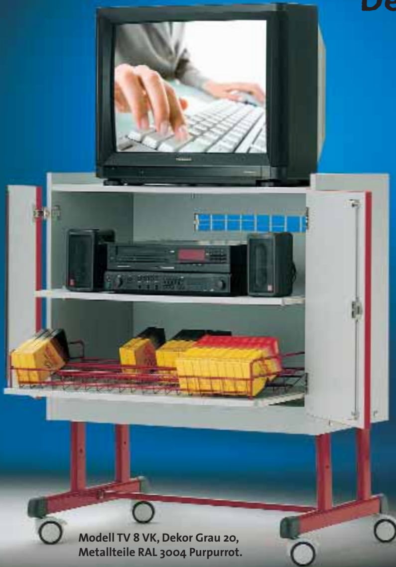
Modell TV 8 VK, Dekor Grau 20, Metallteile RAL 3004 Purpurrot.

Rollzug in 2 Reihen, schrägliegend für ca. 40 Videokassetten oder 80 DVD's.