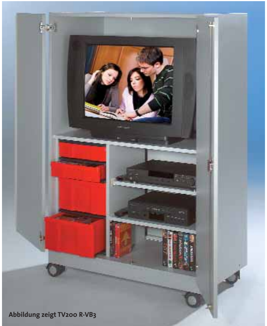
Abbildung zeigt TV200 R-VB3