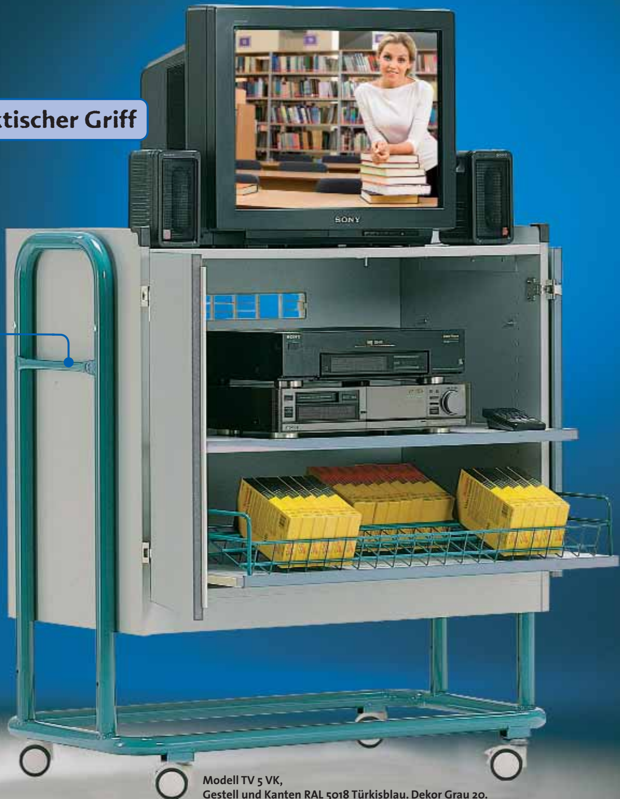
Modell TV 5 VK, Gestell und Kanten RAL 5018 Türkisblau. Dekor Grau 20.