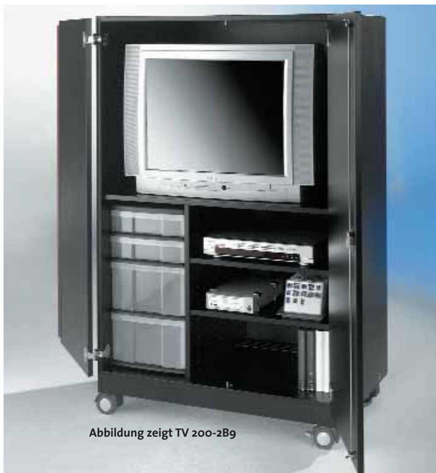
Abbildung zeigt TV 200-2B9