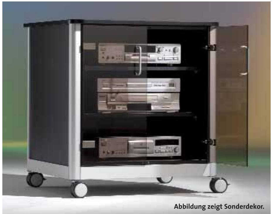
Abbildung zeigt Sonderdekor.

Diese Holz-Alu-Kombination besticht durch ihr elegantes Design, serienmäßig ausgerüstet mit 2 abschließbaren Rauchglastüren, 2 höhenverstellbare Einlegeböden und Elektroanschluss, 3-fach-Steckdose mit 5 m Kabel