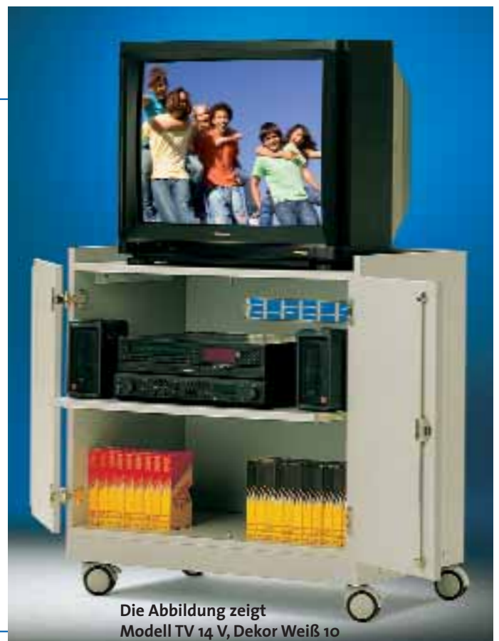
Die Abbildung zeigt Modell TV 14 V, Dekor Weiß 10