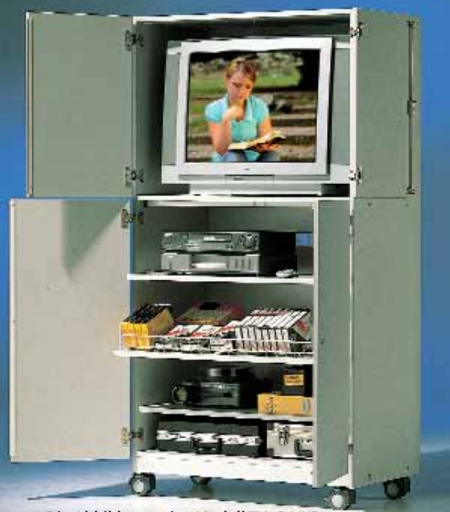
Die Abbildung zeigt Modell TV9R VKB, Dekor Grau 20, Metallteile RAL 7035 Lichtgrau.