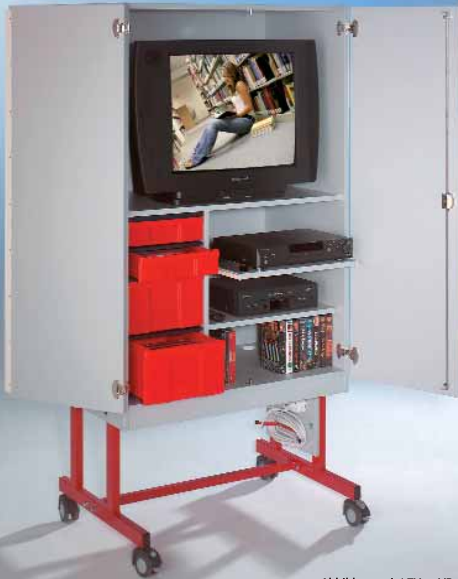
Abbildung zeigt TV20-VB3