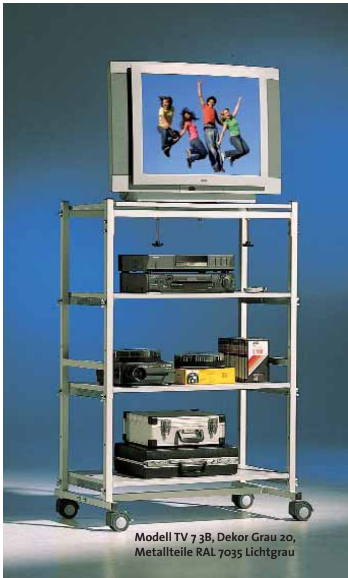
Modell TV 7 3B, Dekor Grau 20, Metallteile RAL 7035 Lichtgrau