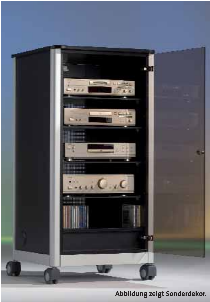
Abbildung zeigt Sonderdekor.