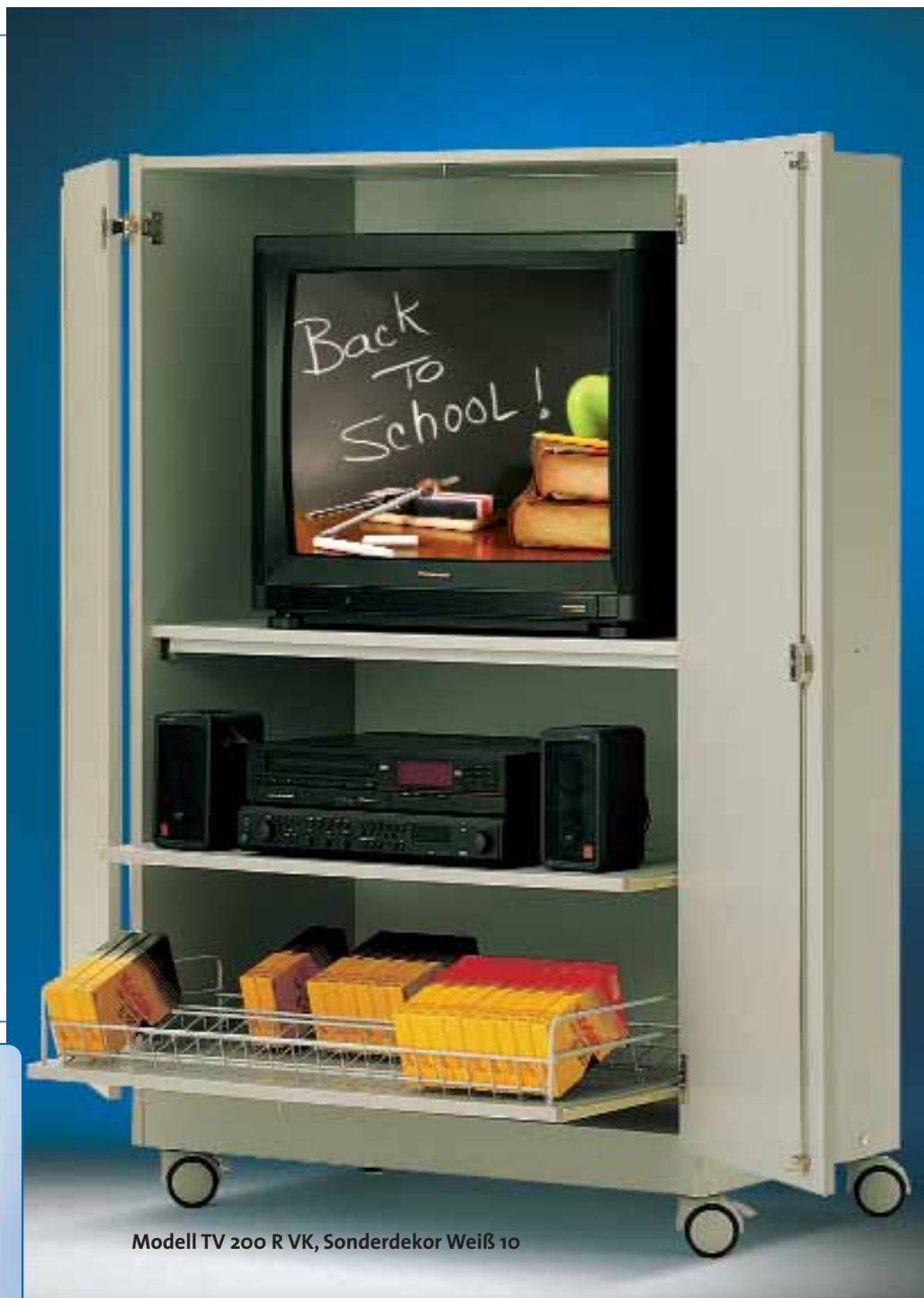
Modell TV 200 R VK, Sonderdekor Weiß 10