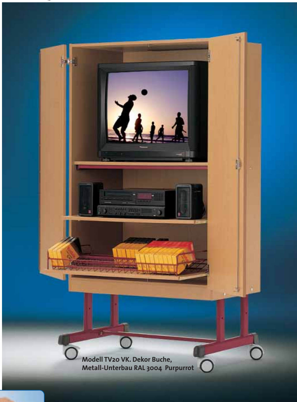
Modell TV20 VK. Dekor Buche, Metall-Unterbau RAL 3004 Purpurrot

Entsprechender Schrank für LCD-, Plasma- oder LED- TVs siehe Seite 39.