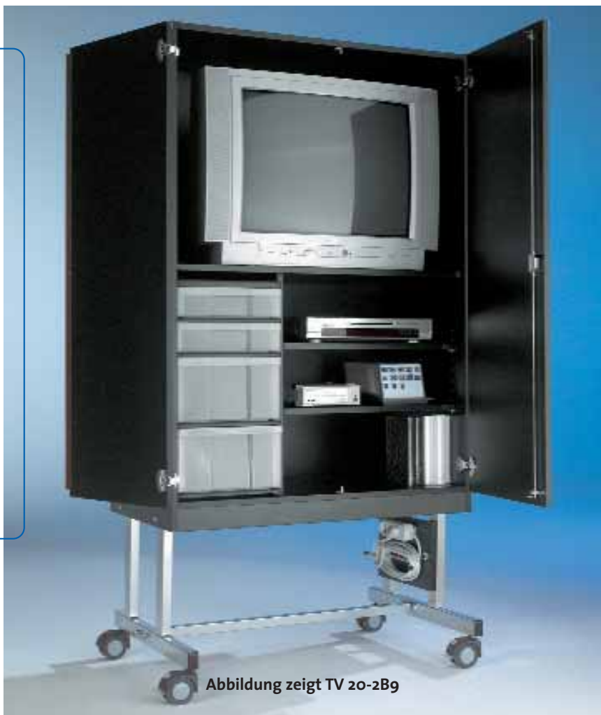
Abbildung zeigt TV 20-2B9