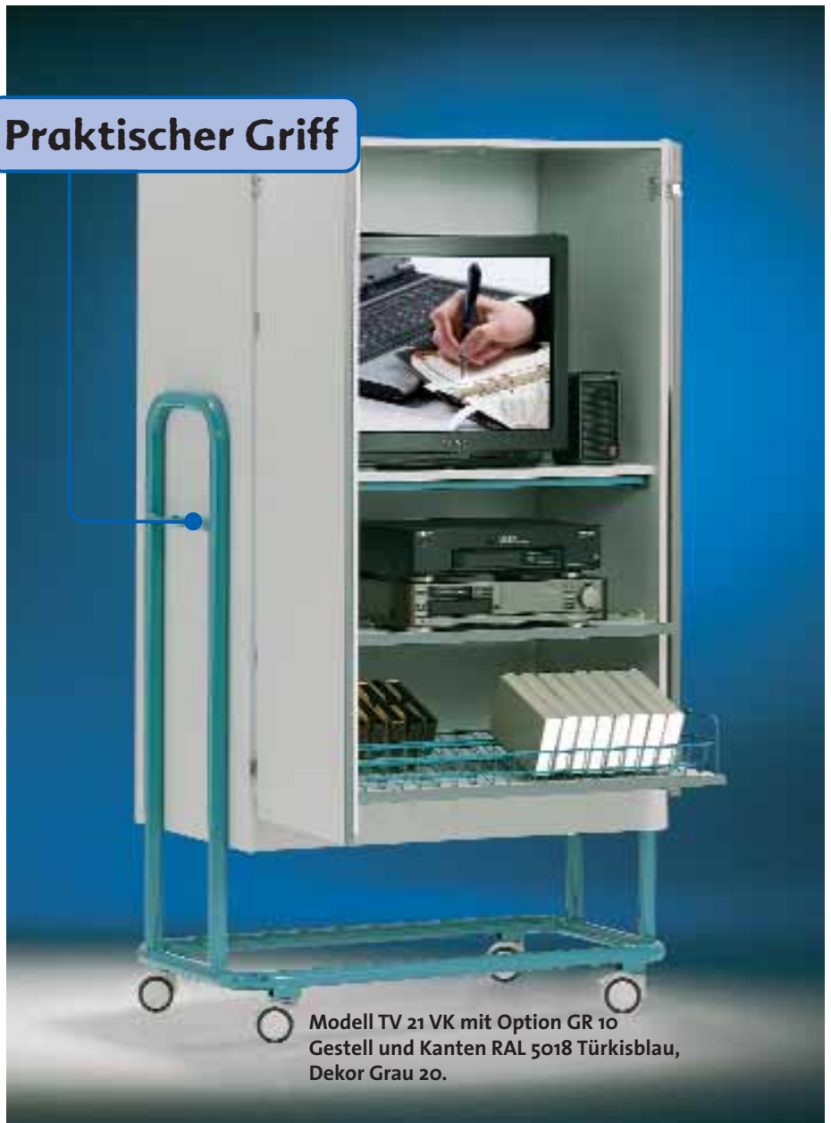
Modell TV 21 VK mit Option GR 10 Gestell und Kanten RAL 5018 Türkisblau, Dekor Grau 20.