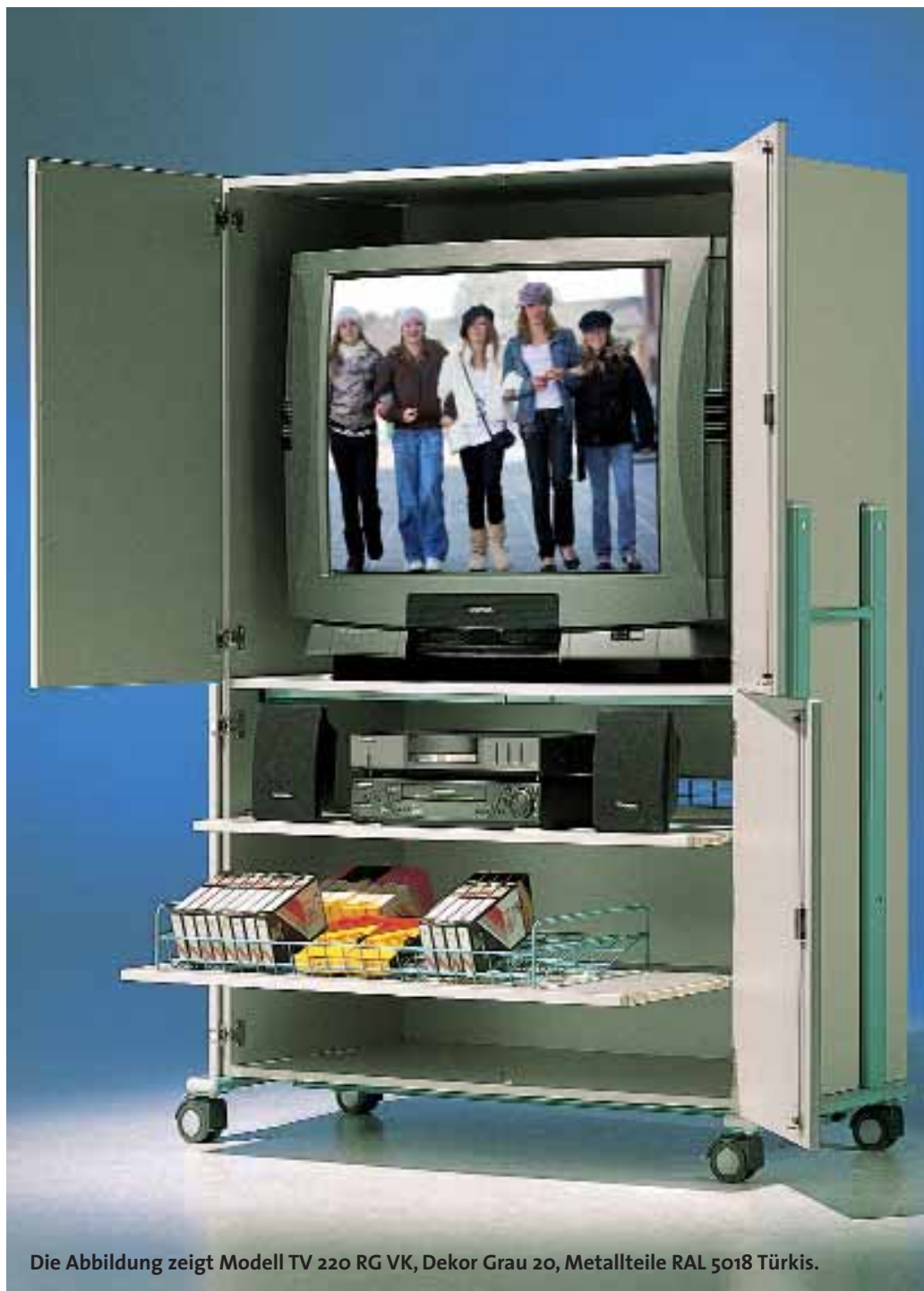
Die Abbildung zeigt Modell TV 220 RG VK, Dekor Grau 20, Metallteile RAL 5018 Türkis.

Entsprechender Schrank für LCD-, Plasma- oder LED-TVs siehe Seite 36.