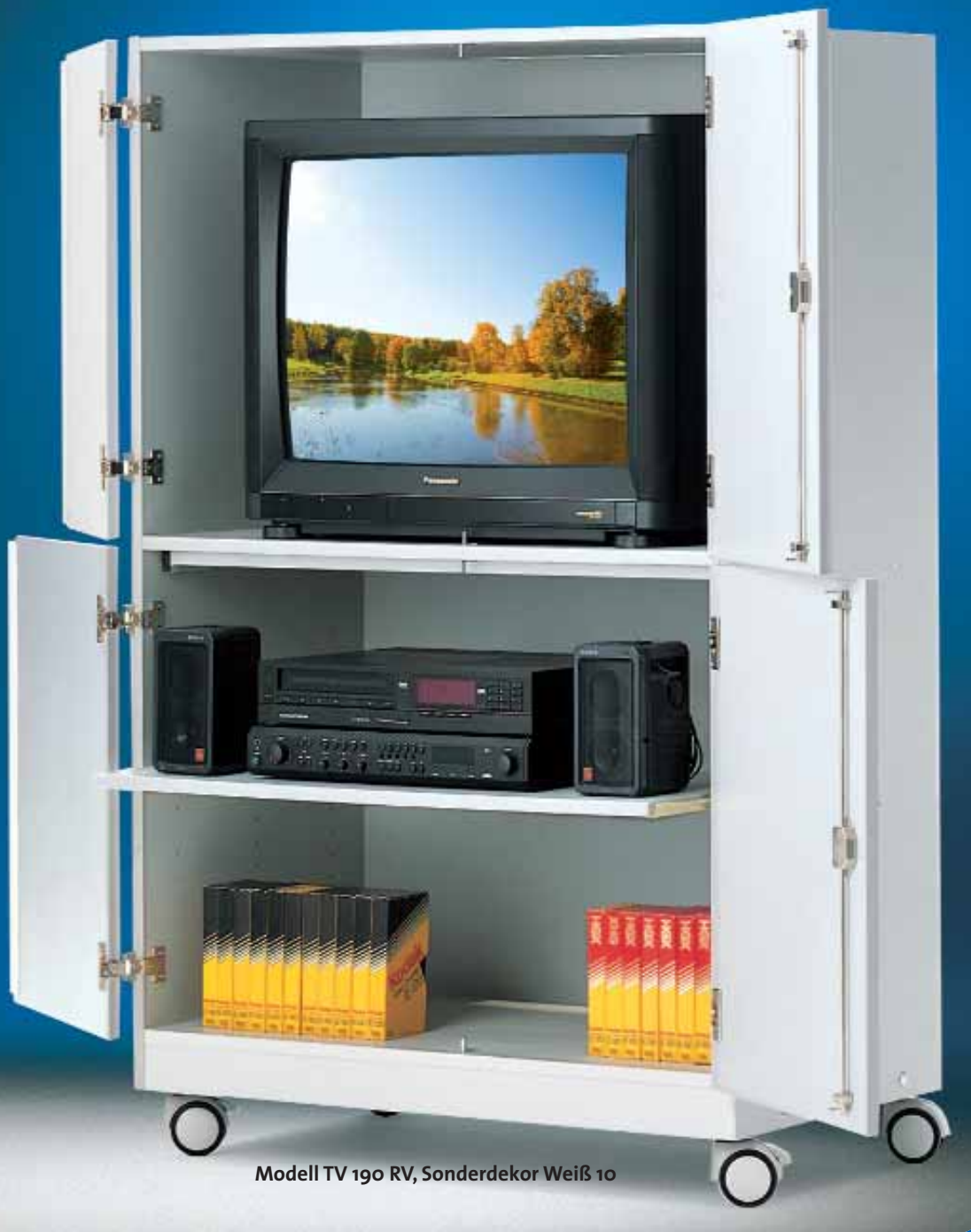
Modell TV 190 RV, Sonderdekor Weiß 10